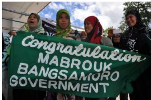
GRP and MILF Peace

Seit der Unabhängigkeit der Republik der Philippinen am 4. Juli 1946 existiert eine Reihe virulenter politischer, wirtschaftlicher und sozialer Konflikte, die bis heute von sämtlichen Regierungen gar nicht oder nur teilweise gelöst werden konnten.